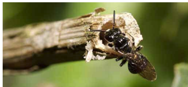
Dai gambi contenenti midollo possono uscire api selvatiche in primavera.

Le prime api selvatiche si mettono in volo già in febbraio, ma in questo periodo nettare e polline sono ancora scarsi. Ecco quello che potete fare voi: in primavera, attirare questi insetti nel vostro giardino con il salice, il croco, la colombina e il piè di gallo. Tagliate i gambi delle piante dell'anno precedente soltanto in maggio, consentendo alle api selvatiche di nidificarvi finché le temperature non si fanno più miti.