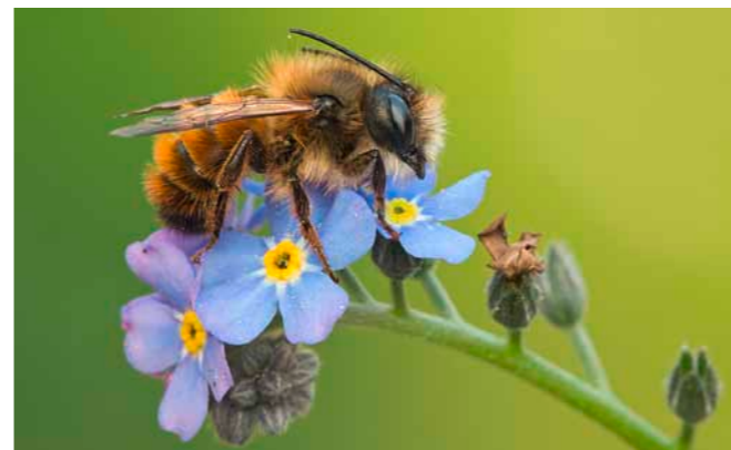
Una grande varietà di fiori estivi è di aiuto anche all'osmia rufa.

La presenza delle api selvatiche dipende dalla disponibilità di luoghi di nidificazione e di cibo. Seminate lungo la recinzione del giardino una miscela di cicoria, gittaione comune o reseda e lasciate crescere il tasso barbasso e l'erba viperina che nascono spontaneamente sul vialetto di ghiaia.